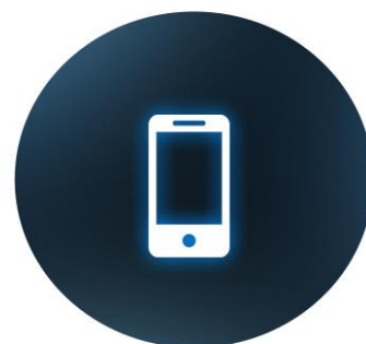
NÚMEROS MÓVEIS VIRTUAIS