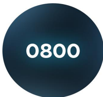
PLANOS COM 0800 - PLANOS 4004/4003