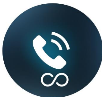
TELEFONIA FIXA ILIMITADA PARA PROVEDORES