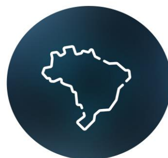
PORTABILIDADE NUMÉRICA NACIONAL