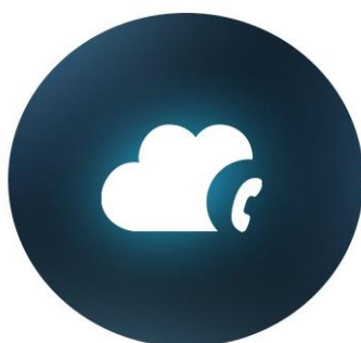
TELEFONIA EM NUVEM CORPORATIVA